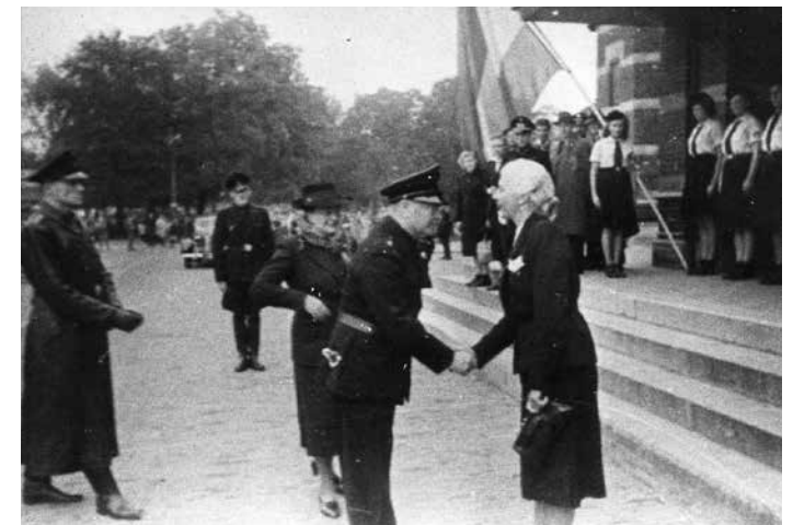
de aankomst van NSB-leider Mussert bij Musis Sacrum te Arnhem voor een openbare vergadering, 1944.

28 oktober was de overbrenging van het eerste digitale archief een feit: het Stateninformatiesysteem (SIS) van de Provincie Gelderland uit de periode 1999 tot 2013. Deze jaren aan bestuursgeschiedenis van de Provincie worden zo eenvoudig online toegankelijk voor burgers en onderzoekers.